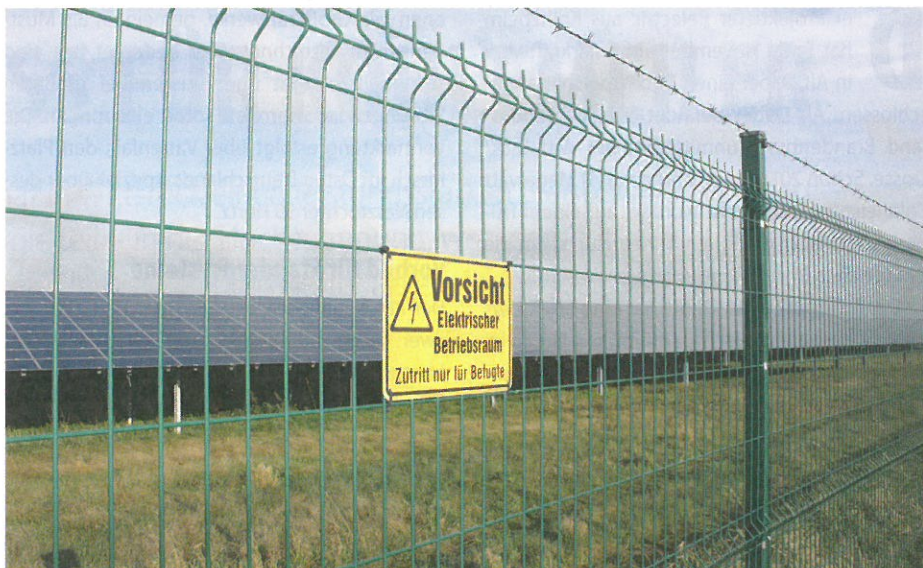
Auf dem früheren sowjetischen Aerodrom installierte Belectric 2012 rund 70 Megawatt.

In Alt Daber blättert Potsdam 376.000 Euro auf den Tisch. Zwei Großspeicher in Neuhardenberg und Feldheim gehen 2015 ans Netz. Das Land Brandenburg unterstützt zudem die Forschungen zu Gasspeichern (Power to Gas).